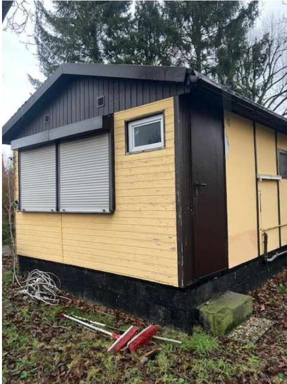
Gartenlaube Rückseite (06.01.2025)