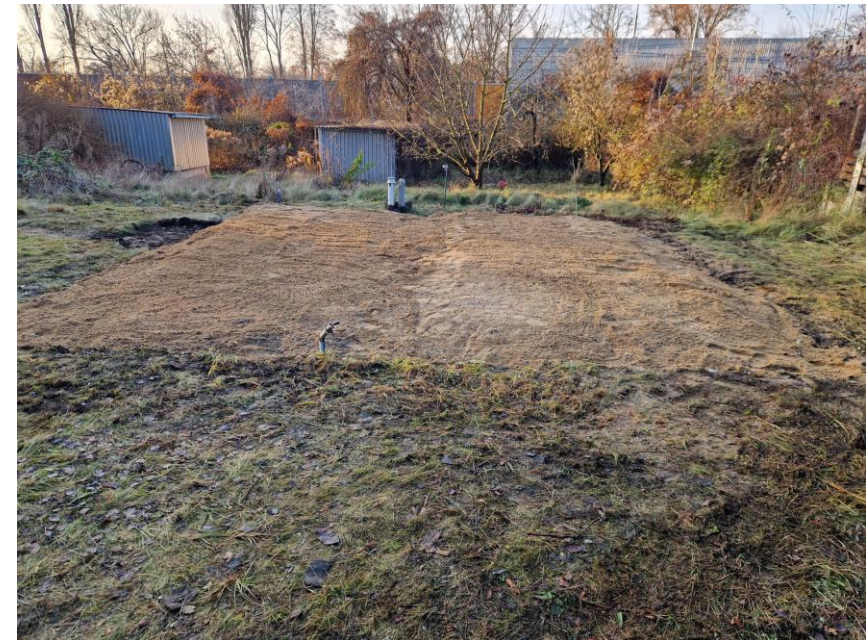
Rückbau Gartenlaube 2, Blick Richtung Westen (02.12.2025,)